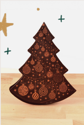
④ Tablette sapin