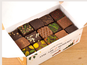
24 Ballotins de Noël