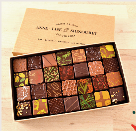
18 Coffrets de chocolats