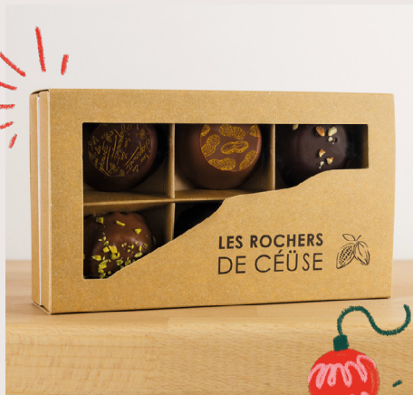
17 Minis rochers de Ceüse