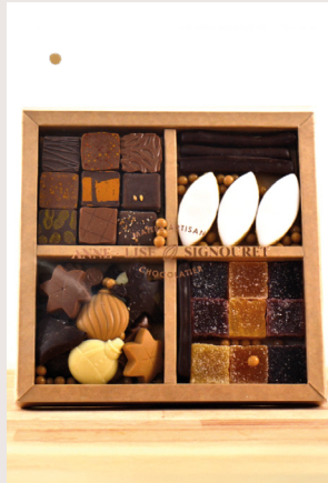
⑤ Assortiment de Noël