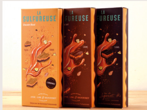
20 La sulfureuse