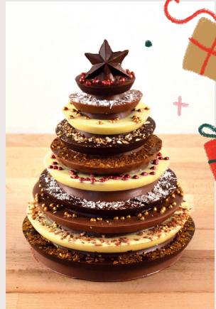
⑥ Mon beau sapin