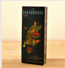
16 La sulfureuse de Dubai