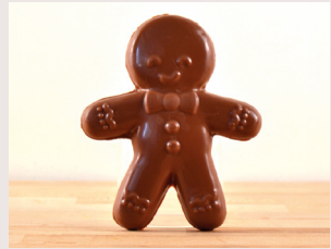
③ Petit Biscuit