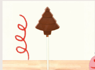
⑨ Sucette sapin