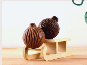
⑫ Duo de boules