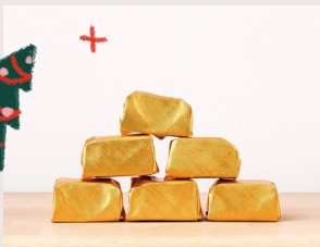
⑩ Marrons glacés