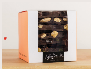
22 Chocolat à croquer