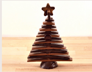
② Sapin de Noël