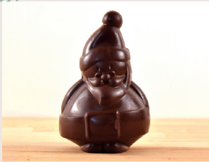
① Père Noël