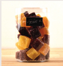
14 Pâtes de fruits